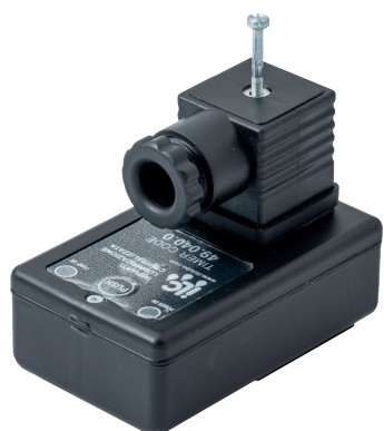
Блок настройки цикла Код для заказа блока: 49.040.0

Положения перемычек при выборе напряжения